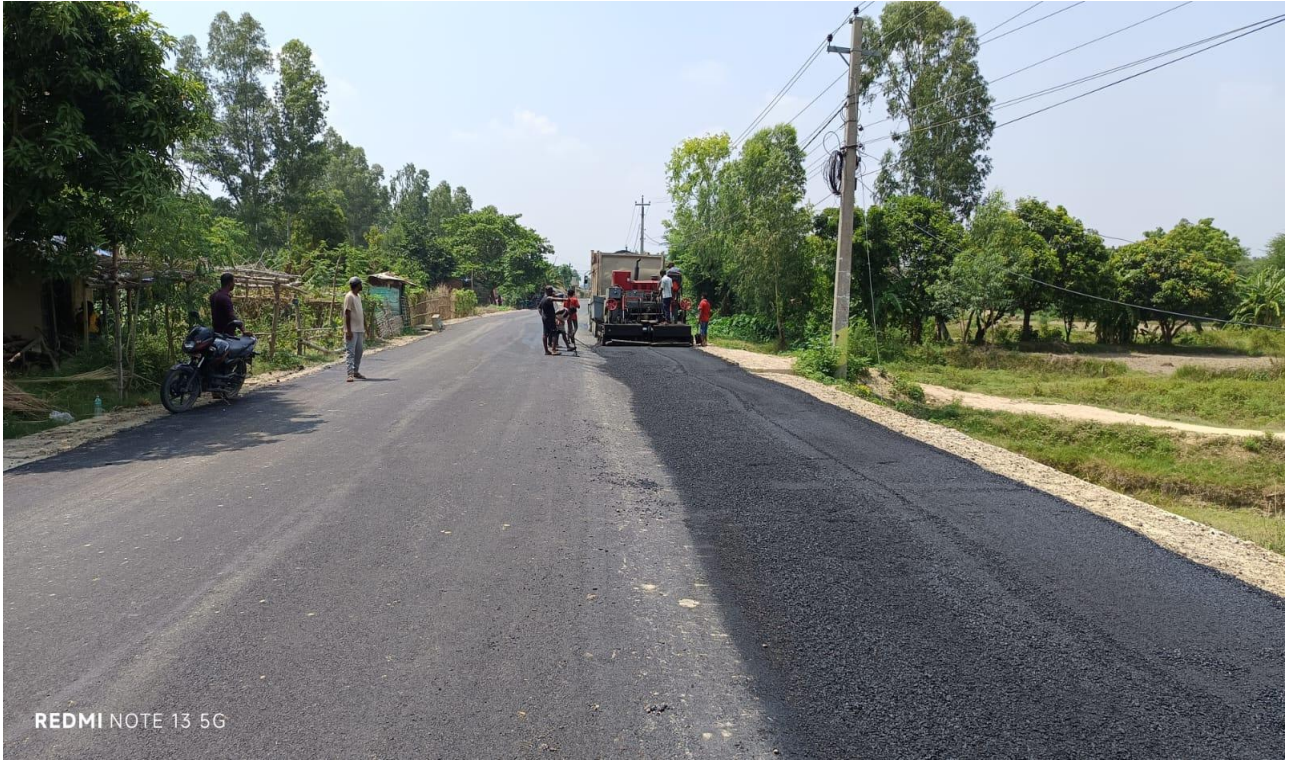
यदुकुहा खजुरी महुवा सडक, धनुषा