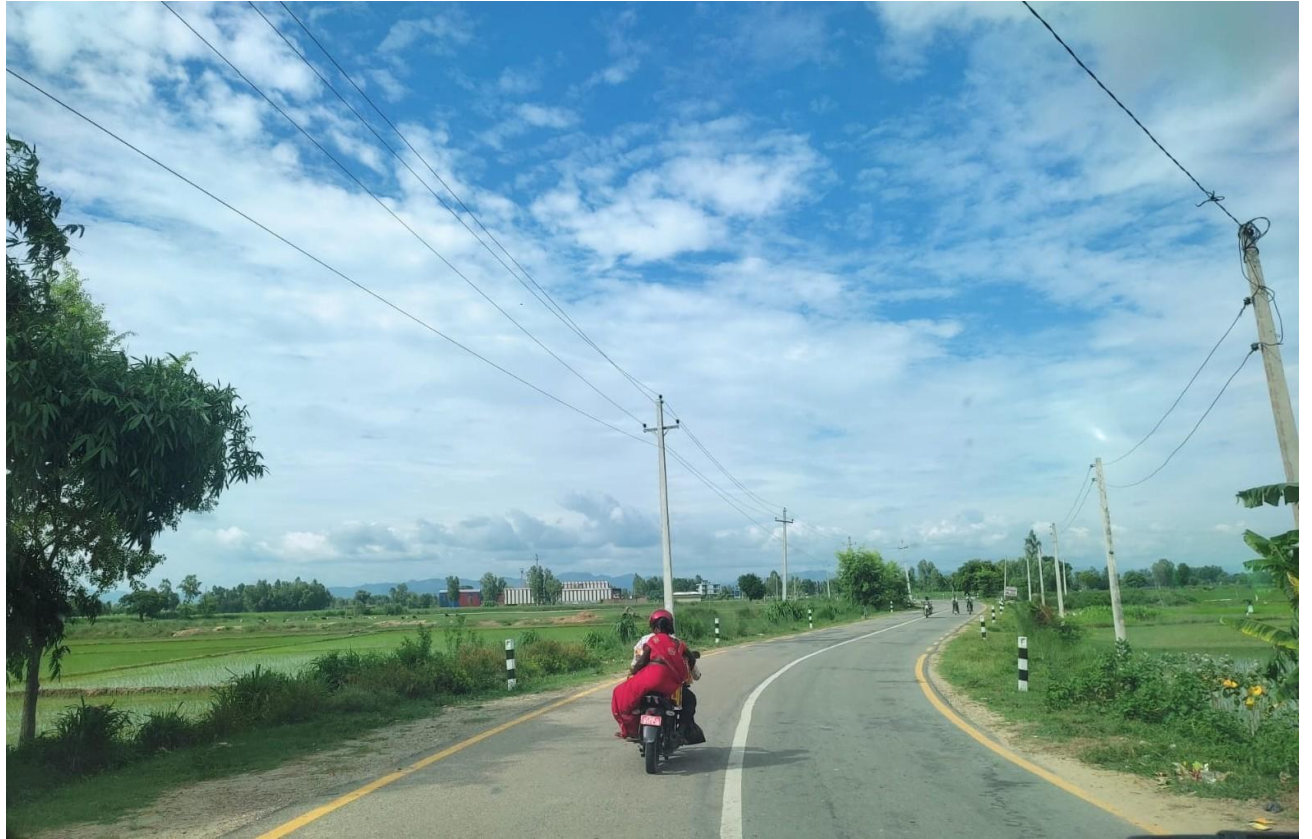
फुल्जोर त्रिभुवननगर सडक, सर्लाही