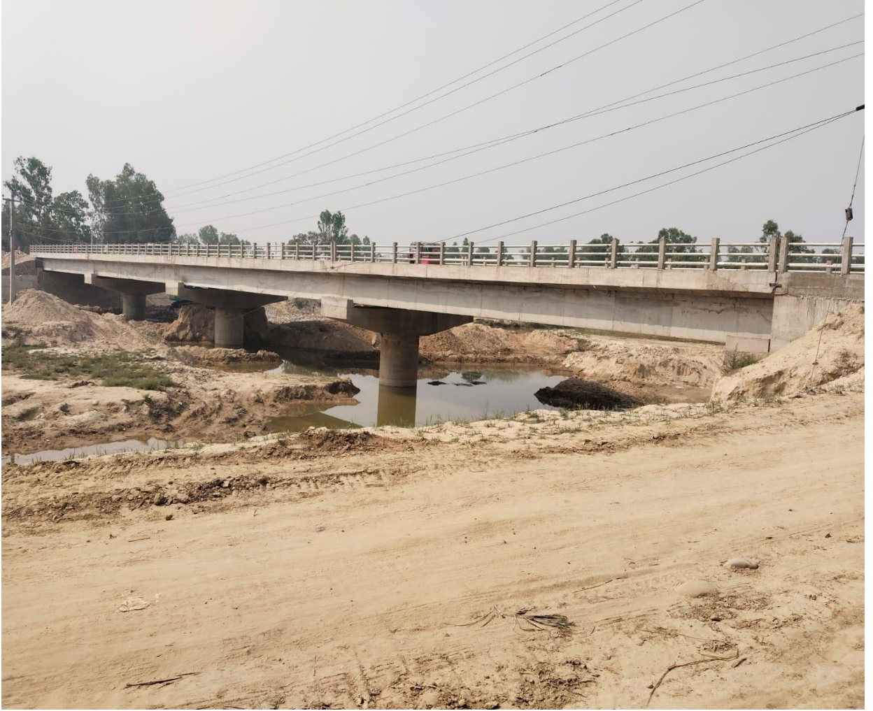
रातु पुल बन्चौरी, महोतरी