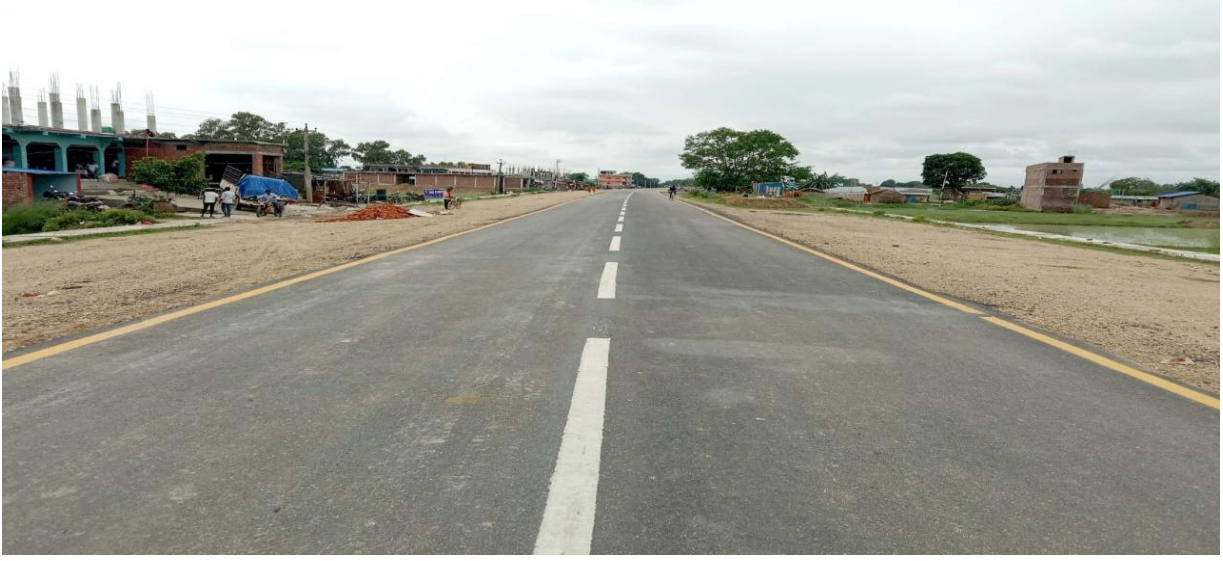
बलान कमला सडक, सिरहा