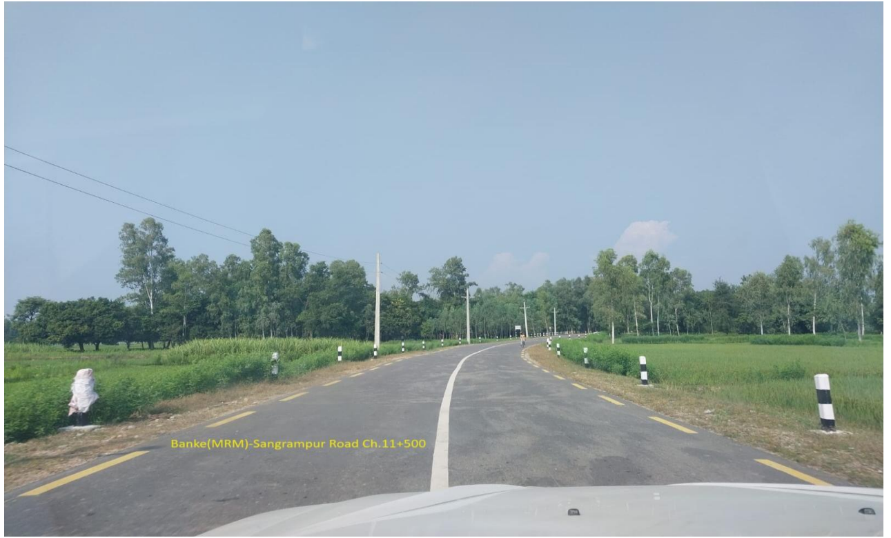
बाँके संग्रामपुर सडक, सर्लाही