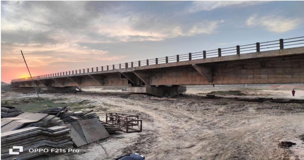
गागन पुल, सिरहा