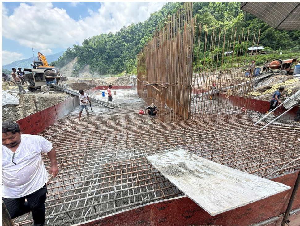
बम्सिलाघाट पुल, उदयपुर