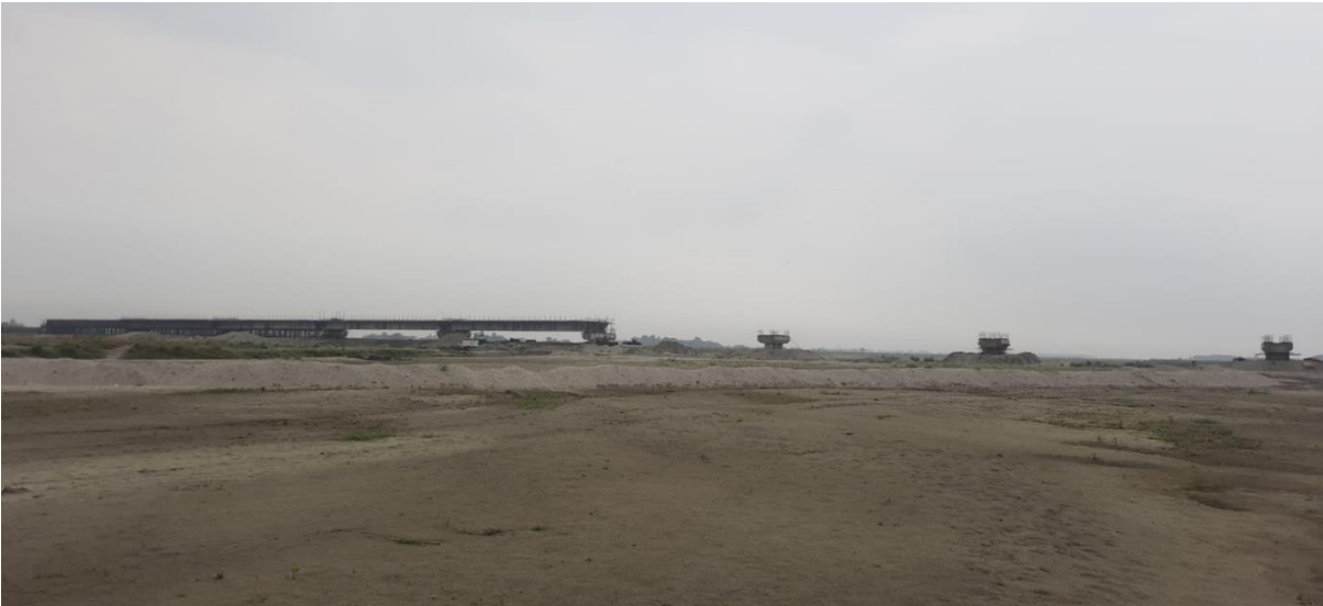
कन्काई नदि पुल, झापा