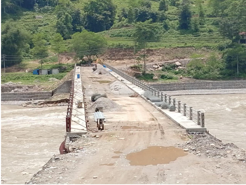
अरुण नदी पुल, कातिकेघाट संखुवासभा/भोजपुर