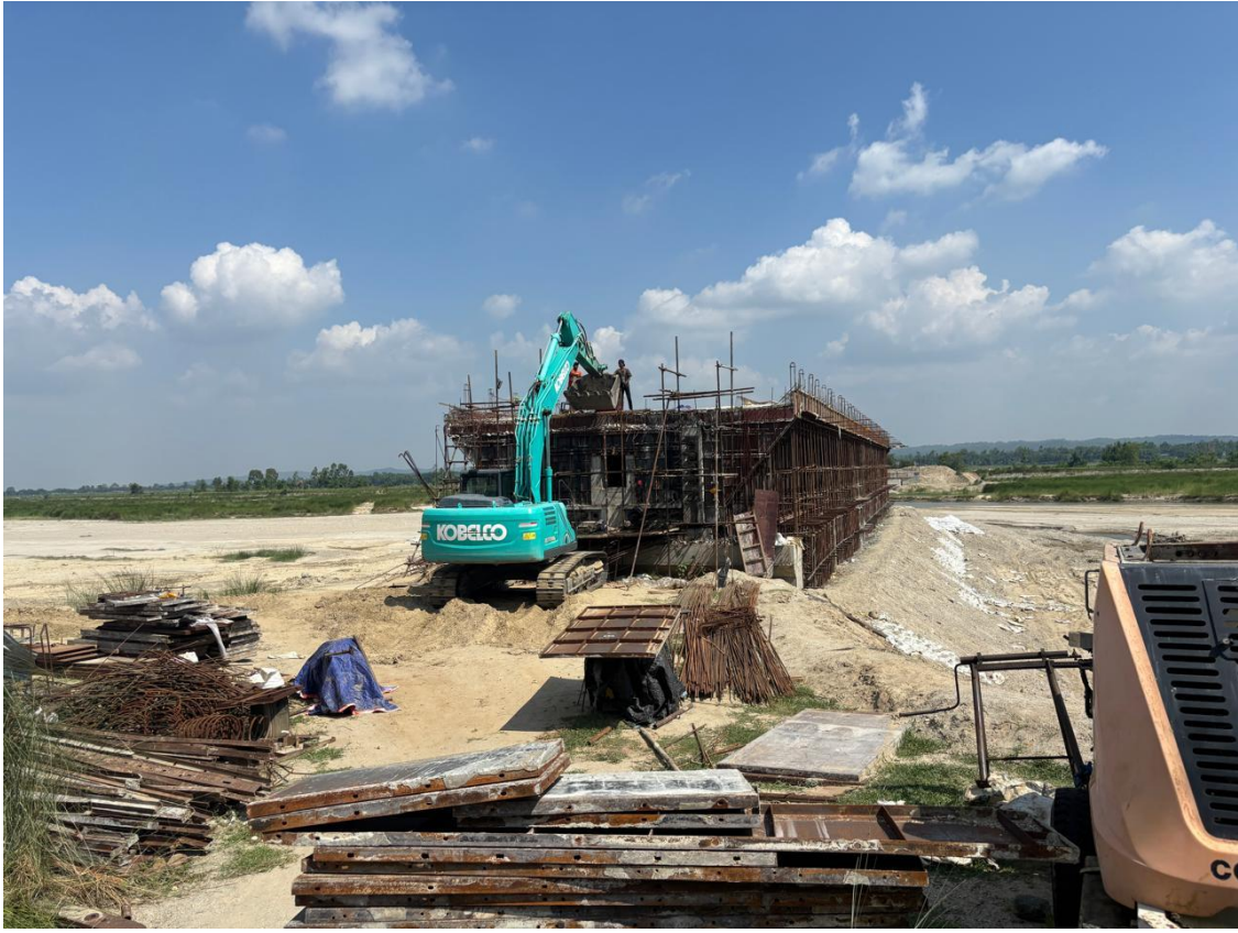
त्रियुगा नदी पुल, उदयपुर