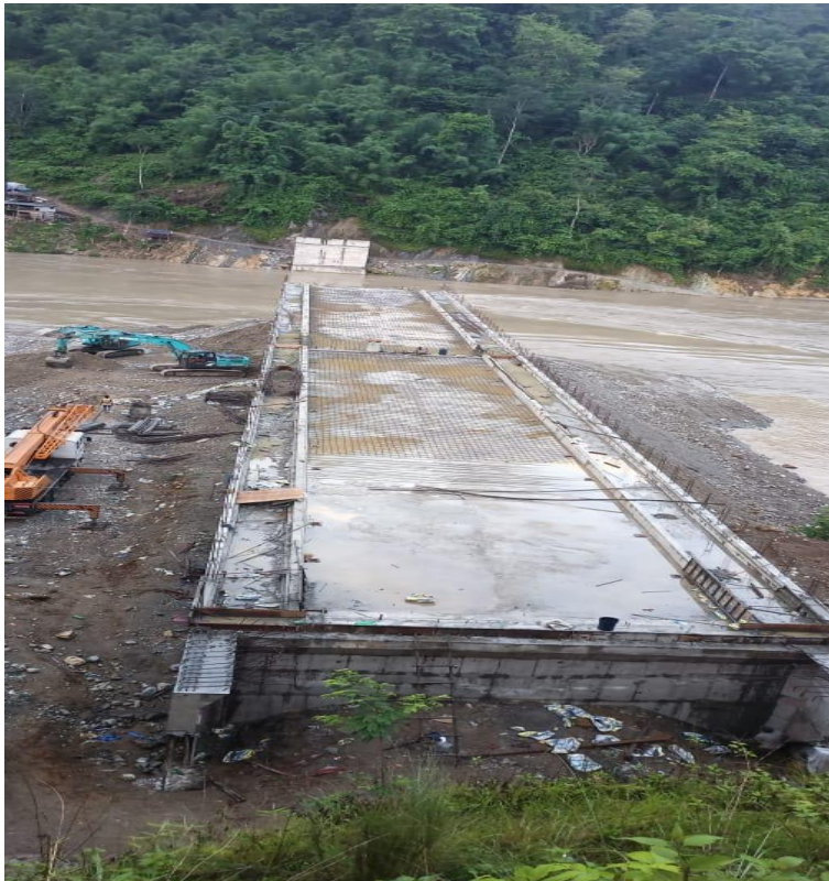
सुनकोशी खोला पुल, उदयपुर-भोजपुर