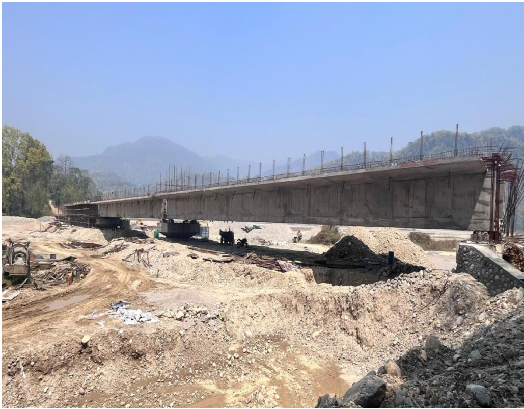
रिखुवा खोला पुल, इलाम