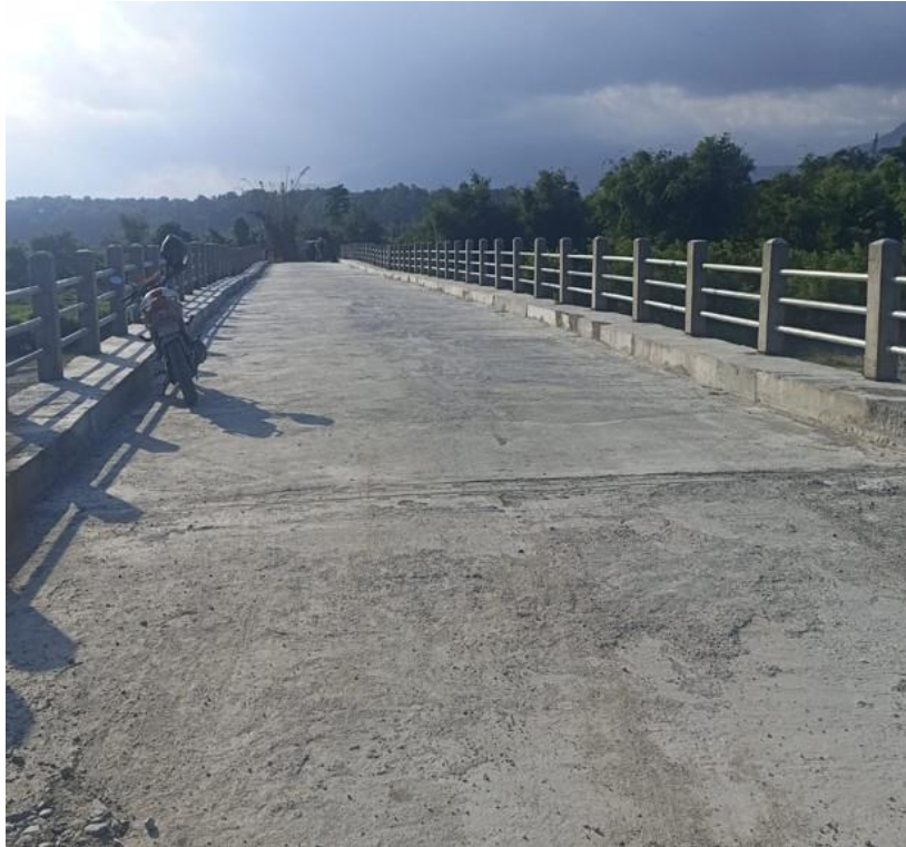
तुर्के खोला पुल, केराबारी, मोरङ